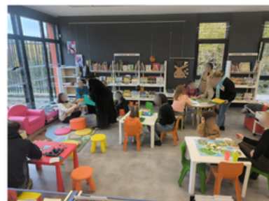
Jouez si vous osez !