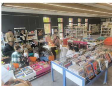
Rencontrer des auteurs