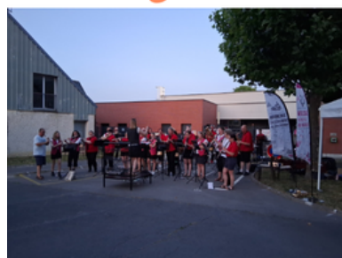
Vive la musique