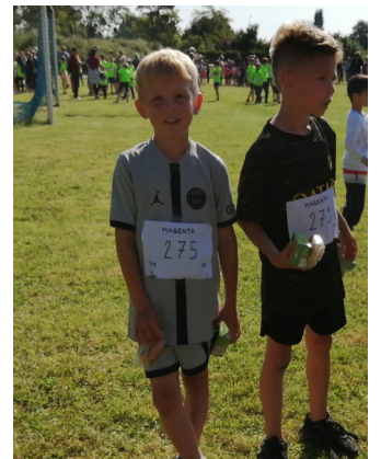
Cross des écoles