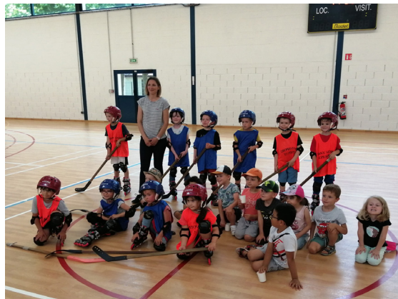
Match de roller école maternelle