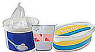
Les pots en plastiques