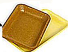
Les barquettes en polystyrène