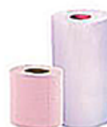
Essuie-tout Papiers hygiéniques