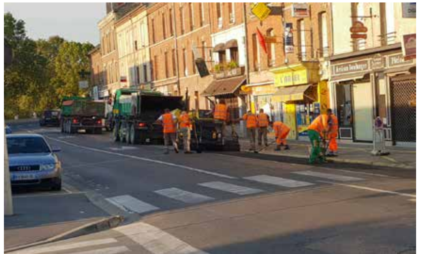
Travaux A.A Thévenet

Construit il y a une vingtaine d'années, le columbarium de 48 cases du cimetière de Magenta était en mauvais état. Le sol s'affaissait de plus en plus. Face à cette situation le sol a été refait, une dalle en béton perméable a été coulée afin de respecter au mieux la nature.