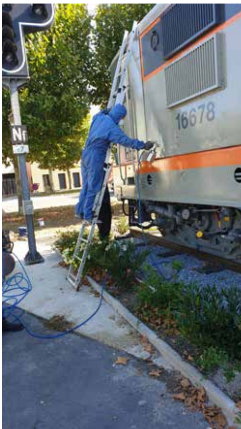
Vernissage de la locomotive

Allée Roland Manayraud Place des Grandes Herbes Quai de la Marine (Pharmacie) Rue de la Grève Place Georges Forêt (coté essieu locomotive)