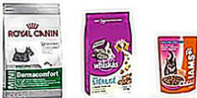
Les emballages de nourriture pour animaux