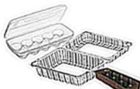
Les emballages en plastique