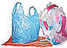
Les films et sacs en plastique