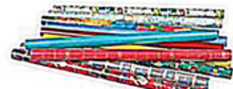
Papiers cadeaux brillants