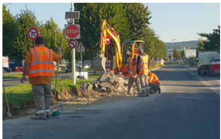
Travaux contre allée