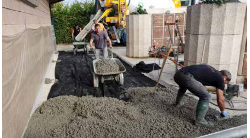
Rénovation du columbarium

Construit il y a une vingtaine d'années, le columbarium de 48 cases du cimetière de Magenta était en mauvais état. Le sol s'affaissait de plus en plus. Face à cette situation le sol a été refait, une dalle en béton perméable a été coulée afin de respecter au mieux la nature.