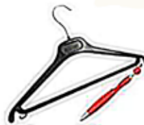
Les objets en plastique