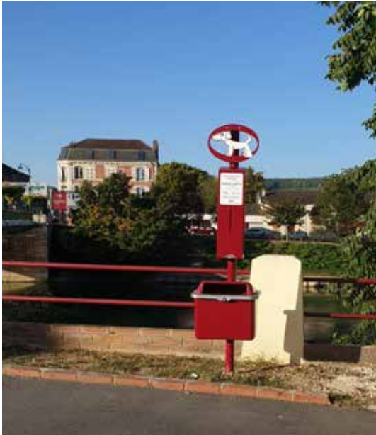
INSTALLATION DE NOUVELLES CROTI' CROTTES

Allée Roland Manayraud Place des Grandes Herbes Quai de la Marine (Pharmacie) Rue de la Grève Place Georges Forêt (coté essieu locomotive)