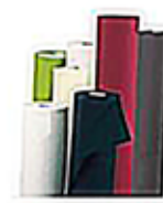
Nappes en papier