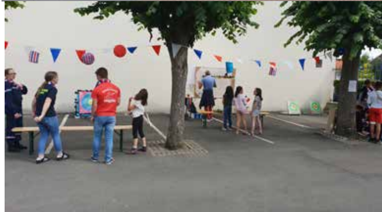
Stands de jeux avec les enfants dans la cour de l'Espace Culturel

Quoi de mieux que de fêter la fête nationale en musique dans un cadre festif ?