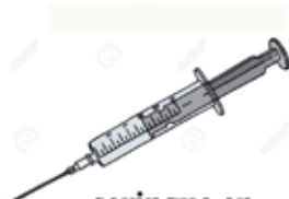
seringue en plastique