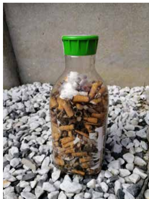
Opération de désherbage et ramassage de 3 bouteilles de mégots