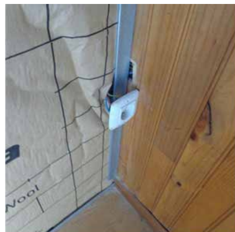
Risque électrique constaté chez un particulier dans la Marne, après une intervention isolation à 1 €.

Une efficacité appréciable sur le plan commercial mais qui déçoit parfois lors de la mise en œuvre ! « Il est vrai que ce n'est pas très bien fait », « Ils n'ont pas posé la bonne épaisseur d'isolant ». Une fois les travaux terminés, le suivi des chantiers est souvent inexistant : « J'ai essayé de les rappeler, mais personne ne répond » ; « ils m'ont même dit qu'il ne fallait pas me plaindre car je n'avais rien payé », etc.