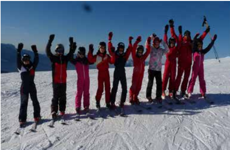
Arrivée à 2100m d'altitude face au Mt Blanc