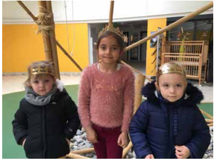
Galette des rois à la restauration scolaire école maternelle