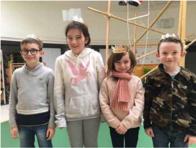
Galette des rois à la restauration scolaire GSAF