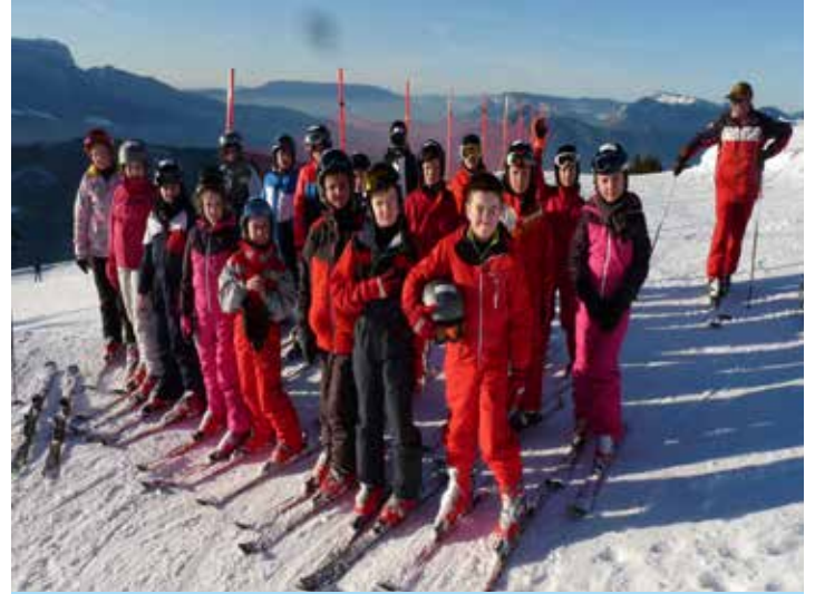
Départ du chalet pour le cours de ski

Les personnes qui ne pratiquent pas le ski peuvent s'orienter sur des balades en raquettes.