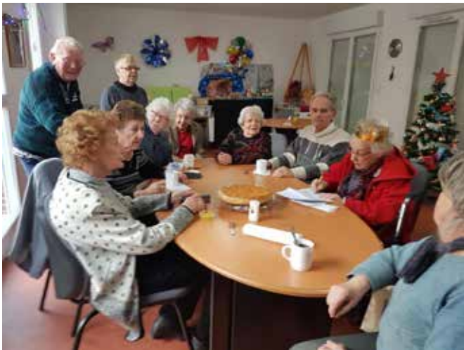
Galette des rois au foyer