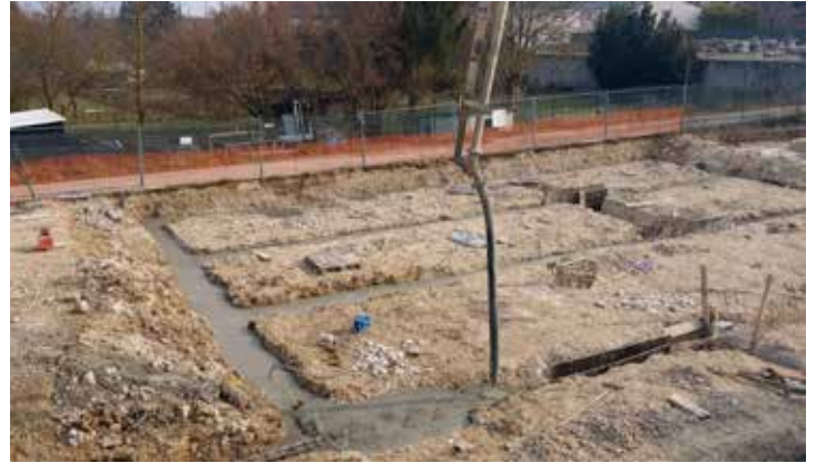
08/03/2016 on coule les fondations