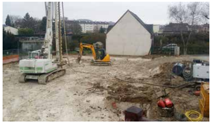
12/01/2016 les bulldozers entrent en action