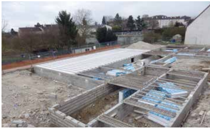
02/04/2016 Pose des hourdis