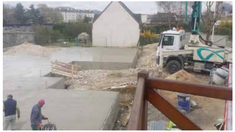
04/04/2016 La dalle est coulée