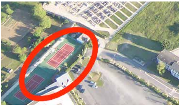
Terrains de tennis 2015