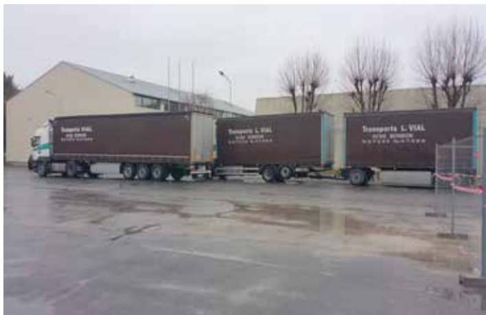
23/12/2016 livraison du mobilier