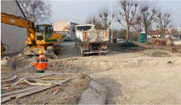
12/01/2016 les bulldozers entrent en action