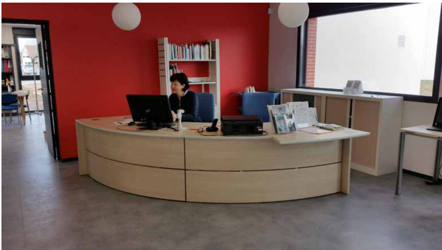
28/02/2017 ouverture de la bibliothèque