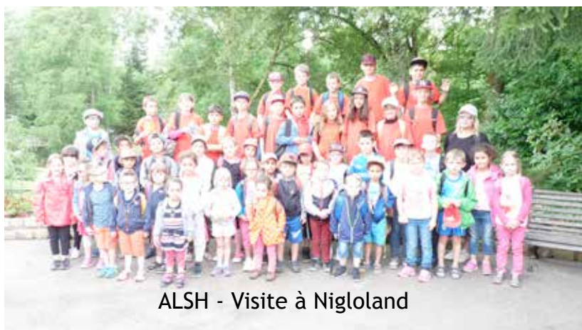
ALSH - Visite à Nigloland

MINISTÈRE DE L'ÉDUCATION NATIONALE, DE L'ENSEIGNEMENT SUPÉRIEUR ET DE LA RECHERCHE