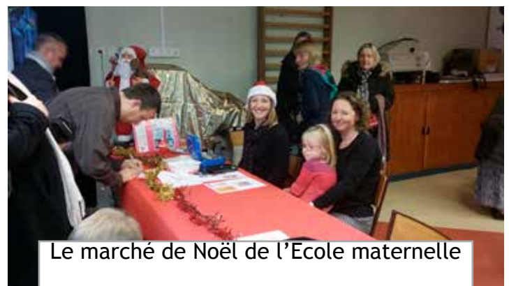
Le marché de Noël de l'École maternelle