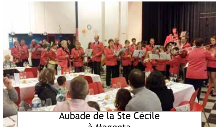
Aubade de la Ste Cécile à Magenta