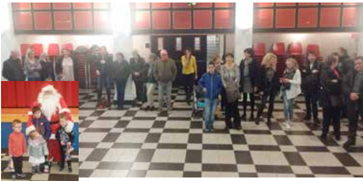
Soirée du personnel communal