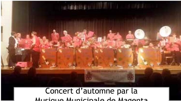
Concert d'automne par la Musique Municipale de Magenta