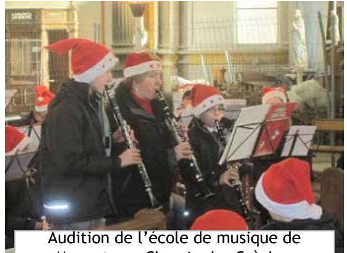
Audition de l'école de musique de Magenta au Chemin des Crèches