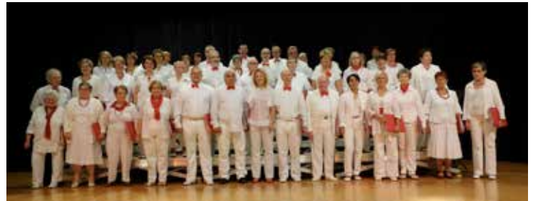
Concert de la Chorale Inter-lude à Magenta