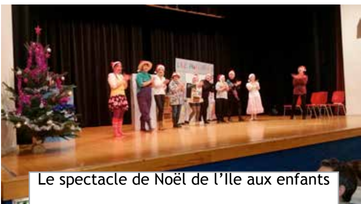
Le spectacle de Noël de l'Île aux enfants