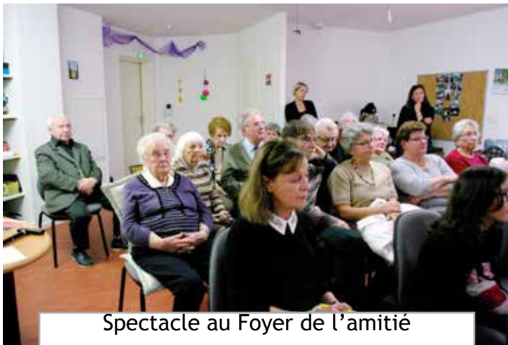
Spectacle au Foyer de l'amitié