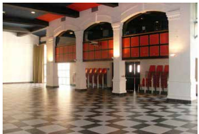
Salle de Spectacles