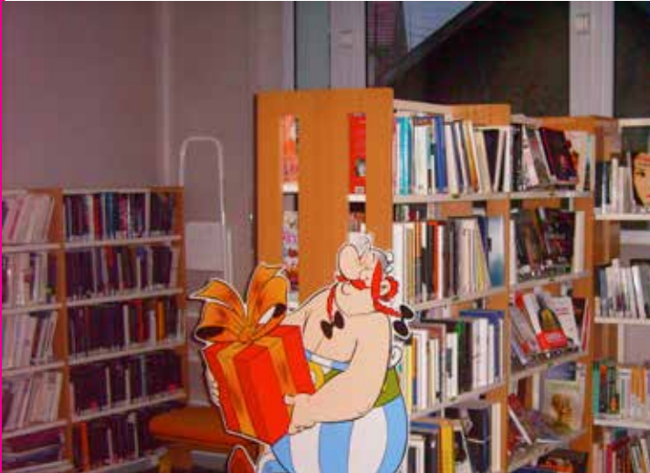
Salle de Réunions