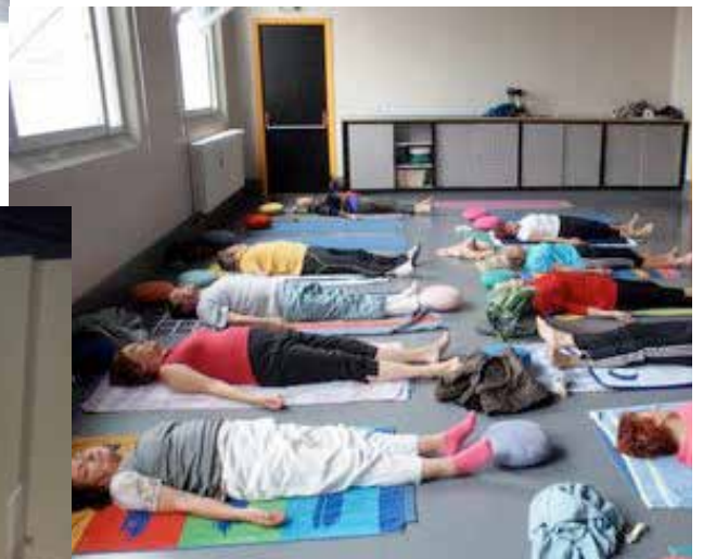
Salle de Gym - Yoga