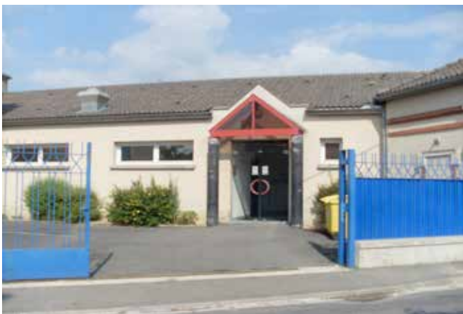
Entrée de service rue Carnot