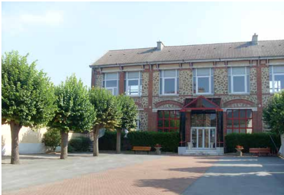
Façade de l'Espace Culturel Pierre GODBILLON