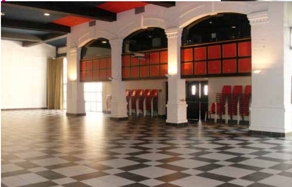
La Salle de Spectacles