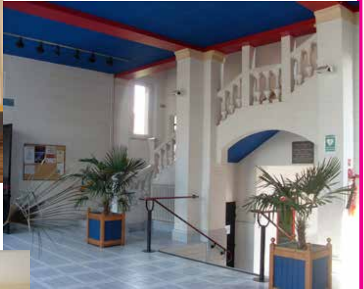
Le Hall d'Entrée