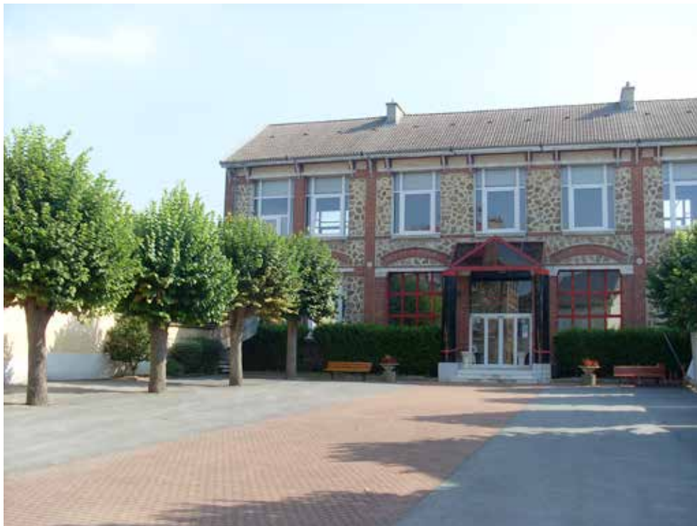
Façade de l'Espace Culturel Pierre GODBILLON